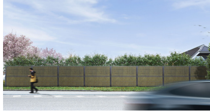
Antracit RAL 7016