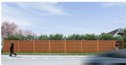
Træbeklædning brun RAL 8003