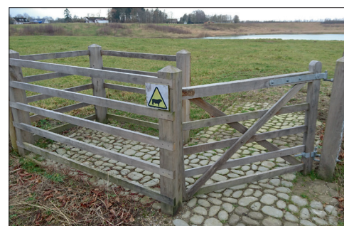
Her er lågen i "position 2". I denne position holdes lågen fast med et enkelt glipfald.