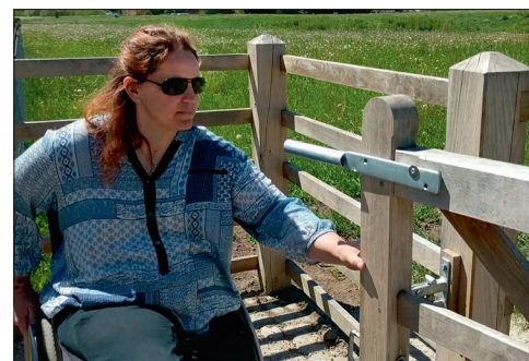
Lågen lukkes op fra "position 1" til "position 2". Lågen er selvlukkende, så den aldrig kan stå halvt åben.

Dyrene kan under ingen omstændigheder slippe ud gennem HandyGaten. Lågen er hængslet, så den sidder en smule på skrå og denne vinkling gør, at lågen automatisk "lukker i". Det er derfor umuligt at efterlade lågen stående halvt åben - og uanset om den står i "position 1" eller "position 2" er HandyGaten altid lukket for dyrene.