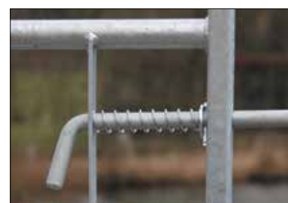
Vnr. 59081: Kraftig låsebolt. Leveres med anslag til stolpe.